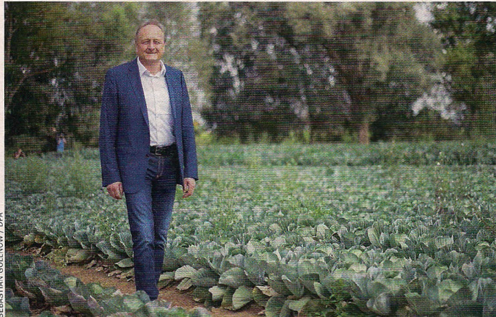
SEBASTIAN GOLLNOW / DPA