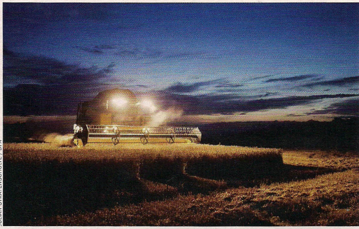
JULIAN STRATENSCHEIT / DPA